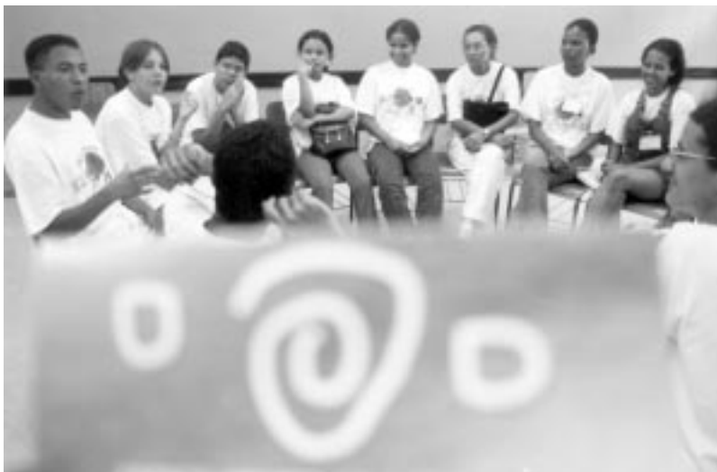
Oficina de trabalho

Passos e Veredas: fazendo caminhos é uma metodologia que busca contrariar as verdades preestabelecidas ou modelos pré-definidos, mas, sobretudo, exercitar a criação de alternativas.