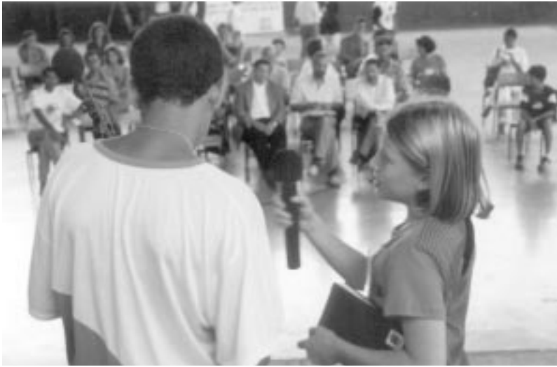
Apresentação no Colégio Médice.

As atividades da plenária foram coadjuvadas pela Equipe do Escritório da UNESCO-MT, pelo grupo mediador e pela equipe do Escritório da UNESCO-Brasil.