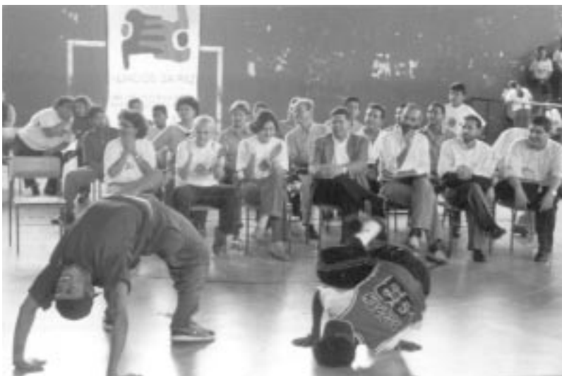
Apresentação de dança de rua.

Cada povo tem seu conhecimento, sua forma de pensar, seu conjunto de valores, suas tradições, que devem ser internamente fortalecidos, mas respeitando e compreendendo a cultura dos outros.