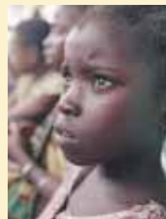
Koki dans la rue à Mombasa, au Kenya.