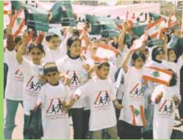
Des enfants libanais se dirigent vers le Parlement.

Plus d'un million de personnes de 110 pays ont participé au Grand Lobby, la manifestation de la Semaine de l'Éducation pour tous, axée cette année sur les quelque 100 millions d'enfants privés d'éducation.