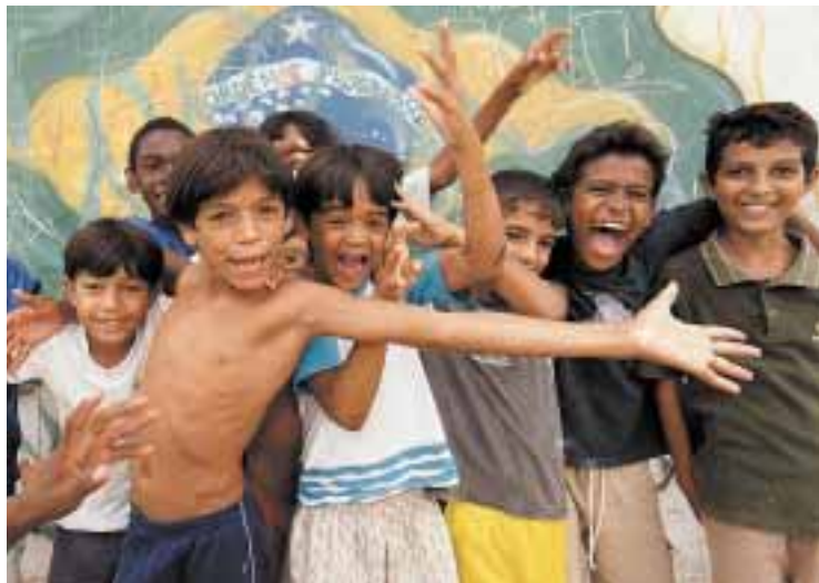
Les écoles ouvertes le week-end détournent les jeunes de la délinquance.