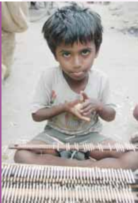
Sa place est à l'école.