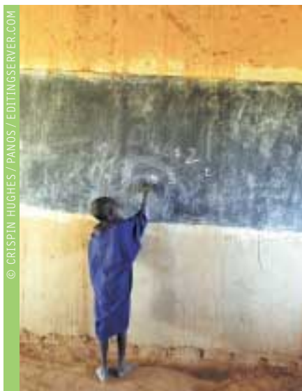
Un enfant de l'école de Tintihigrene, au Mali, où un instituteur fait cours à 65 élèves.

L'évaluation des acquis scolaires n'est qu'une façon parmi d'autres d'apprécier la qualité de l'éducation. Le montant du budget de l'éducation (inférieur au seuil recommandé de 6 % du PNB dans une majorité de pays), le nombre d'élèves par enseignant (trop élevé dans les pays les plus éloignés des objectifs de l'EPT), la durée de la scolarité et le niveau de qualification des enseignants comptent tout autant. Dans certaines régions du monde, le nombre d'années de scolarité,