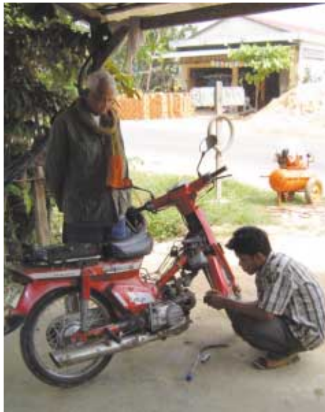
Des savoir-faire utiles peuvent sortir les jeunes de la misère.

Contact : Sue Fox, UNESCO Phnom Penh e-mail : s.fox@unesco.org