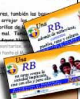
海花 生物圈保护区 哥伦比亚