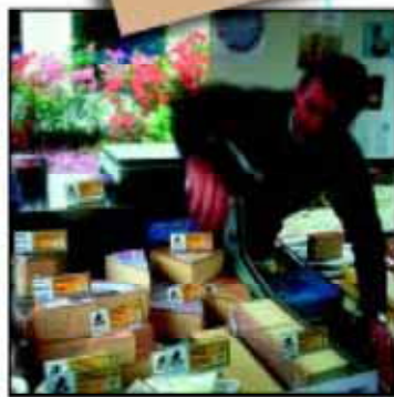
恩特巴赫 生物圈保护区 瑞士

符合特定标准的企业 允许在其产品上使用恩特巴赫生物圈保护区质量标签,例如奶酪和木材等,这样给予生产厂家一个明显的市场优势。该标签逐渐地被顾客所喜爱,因为它表明该产品是环境友好又是保护区当地生产的。现在大约有两百个产品和服务已经拥有使用该标签的资格。