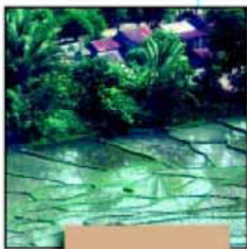
麦纳纳那德 生物圈保护区 马达加斯加

自行动开始 ,就注重当地人优先性,其目的是改善健康和福利(例如增加稻米产量,更好的医疗保健和教育)。所开展的项目也是在改善自然保护的前提下落实这些优先性。