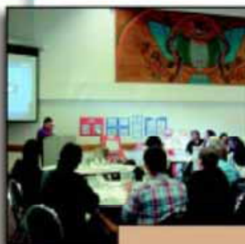
克雷魁特音 生物圈保护区 加拿大

克雷魁特音生物圈保护区 已经提供了一个规划可持续社区发展的框架，当地的经济从依赖于砍树和打鱼转变到一个更为多样化的形式，包括生态旅游、水产业、海洋和林产品。由于自然资源本底的可持续性是最重要的，现在采伐业在一个小规模范围内进行。设法保护特殊的景观特征和倾向于雇用被替换下的林业工人。