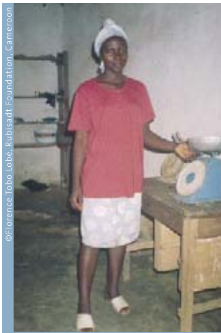
Una estudiante aprende sobre ciencias en Camerún.

“No estamos prometiendo milagros o la Luna”, les comenta Tobo Lobé a sus discípulas. “Estamos aquí con el fin de entregarles la capacitación que les será necesaria para adquirir las destrezas que les permitirán,