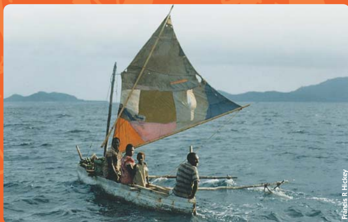
Frédéric R. Hiteley

Una canoa de las islas Maskelyne, al sur de Malekula en Vanuatu, regresa de los jardines de cultivo de la tierra firme. Las prácticas en materia de navegación se basan sobre el conocimiento de las estrellas, corrientes, vientos y animales, estos conocimientos continúan a guiar las jornadas marinas de estos navegadores de las islas del Pacífico.