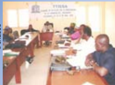
Une vue de l'assistance au séminaire de réflexion

Dans la perspective des activités TTISSA, un projet intitulé « Programme de développement professionnel des enseignants » a été soumis à la réflexion des cadres du Ministère de l'Éducation Nationale et des partenaires internes, les 29 et 30 avril 2009.