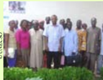
Le chargé de projet de l'UNESCO en compagnie des enseignants de l'école publique de Douggoi à Maroua

Une équipe conjointe UNESCO – le terrain, il apparaît qu'il s'est instauré dans ces écoles une véritable culture des TIC. Cependant, la carence en ordinateurs au sein des dites écoles constitue un facteur bloquant de l'intégration pédagogique des TIC à l'école.