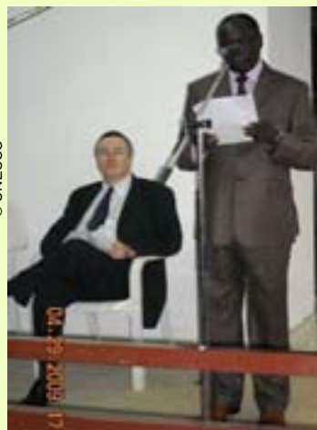
UNESCO Director presenting the speech. At his right, the British High Commissioner

UNESCO in collaboration with the British High Commission and the Cameroon Association of English Speaking Journalists (CAMASEJ) jointly celebrated the 2009 edition of the World Press Freedom Day. The day's celebration began with a volleyball match between Alumni from the UK's Cheevening Scholarship Programme and the High Commission staff in Yaounde which lasted for 40 minutes.