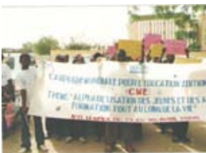
Marche de sensibilisation des élèves au Tchad