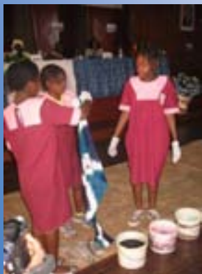
Démonstration de teinture de tissus par les enfants malentendants auditifs, devant l'assistance lors de la cérémonie d'ouverture

a également présenté solennellement le rapport Mondial sur l'EPT 2009.