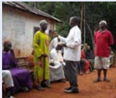
Interview des populations pour une émission à la radio communautaire

Du 15 au 16 avril 2009, une mission du secteur communication du Bureau de Yaoundé s'est rendue à Douala pour rencontrer l'IFAD, dans le but de préparer un partenariat entre les deux institutions pour l'amélioration de la qualité des émissions produites par les radios communautaires sur les thèmes Agriculture/Elevage, déve-