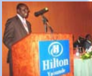
Discours du Directeur lors de la cérémonie de clôture

La revue de la Stratégie Sectorielle de l'Education du Cameroun endossée en Juin 2006 par les Partenaires Techniques et Financiers (PTF), s'est tenue du 13 au 14 avril 2009 à Yaoundé, avec comme participants les Ministères en charge du secteur de l'éducation du Cameroun, conduits par le ministère de l'éducation de base et impliquant les PTF (Banque Africaine de Développement,