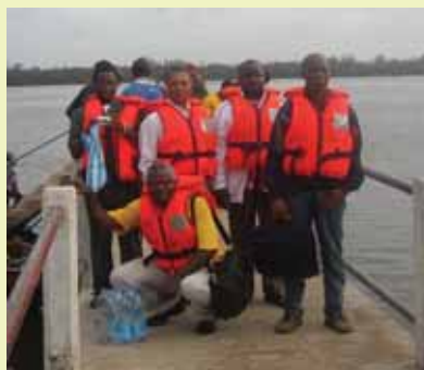
L'équipe de la mission à Bakassi

Une mission conjointe UNESCO-Ministères de la Communication, du plan et l'aménagement du territoire a séjourné dans la presqu'île de Bakassi du 9 au 16 juin 2009 dans la perspective de la mise en place d'une radio communautaire et des télécentres polyvalents.