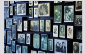
معرض صور شخصية عائلية، في متحف الدولة في أوشفيتز، ببيركنو

السياسات التدميرية التي اتبعتها ألمانيا النازية والمتعاونون معها. وينبغي، عند دراسة الحالات الأخرى لأعمال الإبادة الجماعية، أن يولي الاهتمام للسياسات الخاصة بكل حالة من هذه الحالات. وتشكل المقارنة البنيوية بين عمليات الإبادة الجماعية هذه أساس الدراسات المقارنة لحالات الإبادة الجماعية. غير أنه لا يمكن لأي أحد أن يفترض أن معاناة ضحايا الهولوكوست كانت أكبر من معاناة أولئك الذين قُتلوا في عمليات أخرى للإبادة الجماعية. فينبغي أن يتم فهم كل مثال من أمثلة أعمال العنف الجماعي، بما فيها حالة الهولوكوست، فهماً محدداً خاصاً بالحالة المعنية، بدون التقليل من شأنها، أو الاستهانة بها، أو نكرانها.