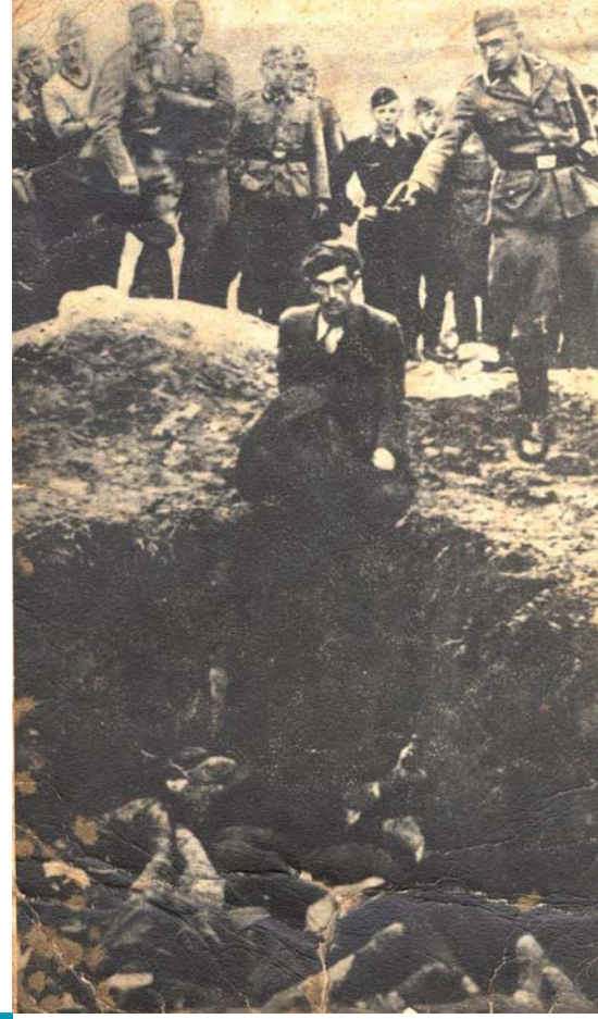
فبينتزا، في أوكرانيا، جنود ألمان يشاهدون جندياً من «فرق القتل الخاصة» وهو يقتل يهودياً، في تموز/ يوليو ١٩٤١

في ألمانيا فقط، وإنما في معظم البلدان الأوروبية، إلى التوعية بشأن أدوار ومسؤوليات الدولة والأفراد والمجتمع ككل في مواجهة تزايد انتهاكات حقوق الإنسان. ومن الأمثلة الأخرى الجديرة بالدرس في هذا الصدد تصرفات الأطباء والمرضات الألمان في إطار تطبيق برنامج القتل الرحيم المسمى بـ«العملية T4» في ألمانيا النازية (التي أدت إلى قتل أكثر من ٢٠٠ ٠٠٠ شخص من المعوقين عقلياً أو جسدياً من الرجال والنساء والأطفال على مدى ست سنوات). وبالمثل، فإن مشاركة الجنود الألمان العاديين في قتل أكثر من مليون يهودي كجزء من عمل «فرق القتل الخاصة» في الأجزاء الشرقية من أوروبا، تدفع إلى التساؤل بشأن سلوك الإنسان، ونزعة الانسياق، وقوة الإيديولوجيات، وباختصار بشأن مسوغات تأييد المجتمع لحكومات تقوم بأفعال تنتهك حقوق الإنسان المعترف بها دولياً. إن بإمكان التعليم بشأن الهولوكوست أن يساعد الشباب على فهم أفكار هامة كقيلة بأن تفيدهم في دراسة أمثلة أخرى عن ممارسات العنف الجماعي. وحين يستكشف الطلاب تاريخ حالات أخرى لانتهاكات جماعية لحقوق الإنسان، سيمكنهم الاعتماد في ذلك على فهمهم لأحداث الهولوكوست، وسيصبحون أكثر وعياً بمسؤولياتهم كمواطنين عالميين.