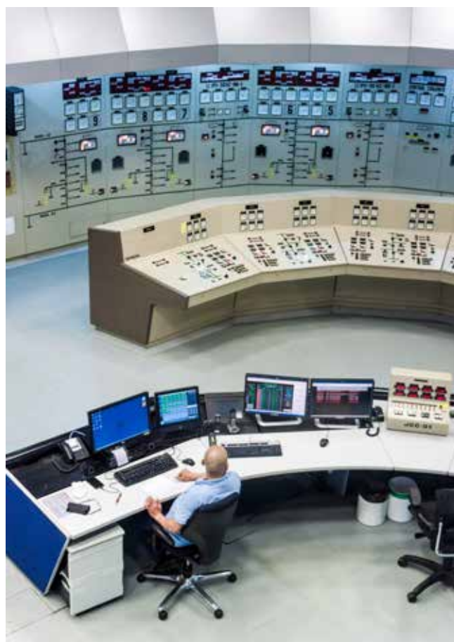
Salle de commande d'une centrale hydroélectrique

Il est essentiel que les investissements liés à l'eau soient conçus conjointement avec les secteurs connexes, tels que l'agriculture, l'énergie et l'industrie, afin de maximiser les résultats positifs en termes de croissance et d'emploi. Dans un cadre réglementaire adéquat, les partenariats public-privé (PPP) offrent un potentiel pour les investissements indispensables dans les secteurs liés à l'eau, y compris dans la construction et l'exécution de l'infrastructure d'irrigation et l'infrastructure pour l'approvisionnement, la distribution et le traitement de l'eau. Afin de promouvoir la croissance économique, la réduction de la pauvreté et la viabilité environnementale, il est nécessaire d'évaluer quelles méthodes atténueraient la perte ou la délocalisation d'emplois dûs à la mise en œuvre d'une approche intégrée dans la gestion de l'eau.