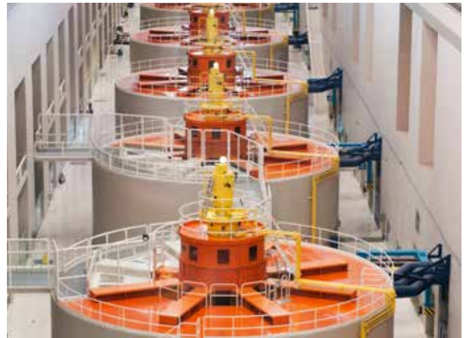
Geradores de energia hidroelétrica

A indústria é uma importante fonte de empregos decentes em todo o mundo e representa um quinto da força de trabalho mundial. A indústria e a manufatura representam aproximadamente 4% da captação mundial de água, e prevê-se que, até 2050, somente a manufatura poderá aumentar seu uso de recursos hídricos em 400%. Com a melhoria da tecnologia industrial e a maior compreensão sobre o papel essencial da água na economia, bem como das tensões ambientais geradas sobre os recursos, a indústria está tomando medidas para reduzir seu consumo de água por unidade produzida, melhorando assim a produtividade industrial com relação ao uso da água. Mais atenção está sendo direcionada para a qualidade da água, especialmente à jusante. A indústria também está se esforçando para reutilizar e reciclar água, combinando a qualidade da água para uso e se movendo na direção de uma produção mais limpa, com possíveis benefícios em termos de empregos melhor remunerados dentro da indústria (para os funcionários treinados), assim como fornecedores de equipamentos de tratamento de água.