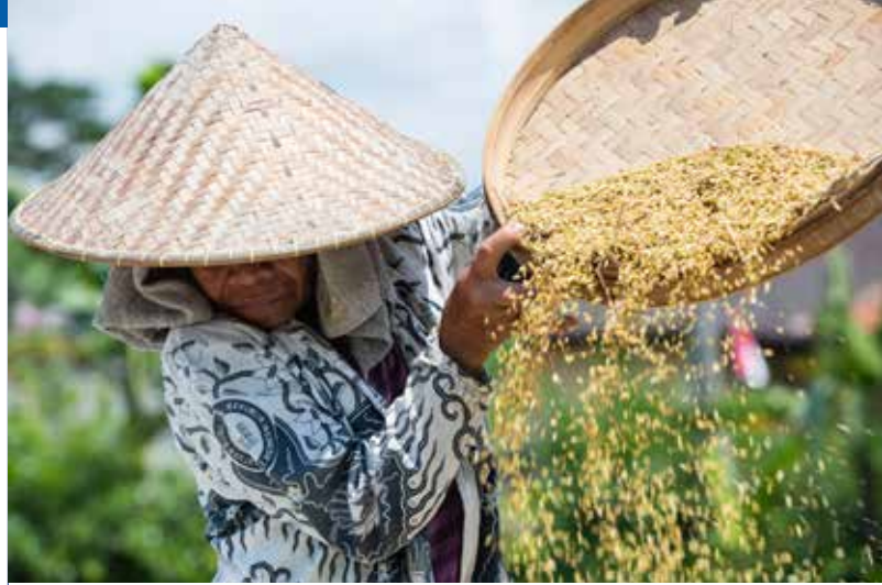
Riziculteur à Ubud, sur l'île de Bali, en Indonésie

En résumé, 78% des emplois dans le monde dépendent de l'eau.