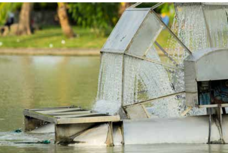
Turbine hydraulique de Chaipattana, dans un parc public en Thaïlande

La demande en énergie augmente, particulièrement en matière d'électricité, dans les économies émergentes ou en développement. Le secteur de l'énergie prélève des quantités croissantes d'eau, correspondant aujourd'hui à 15% du total mondial. Cependant, il crée aussi des emplois directs. La production d'énergie est une condition pour le développement et permet la création d'emplois directs et indirects dans tous les secteurs de l'économie. La croissance du secteur de l'énergie renouvelable mène également à une croissance dans le nombre d'emplois verts et d'emplois qui ne dépendent pas de l'eau.